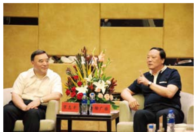
中国建材集团、国药集团董事长宋志平与宁夏回族自治区党委常委、银川市委书记徐广国进行友好会谈