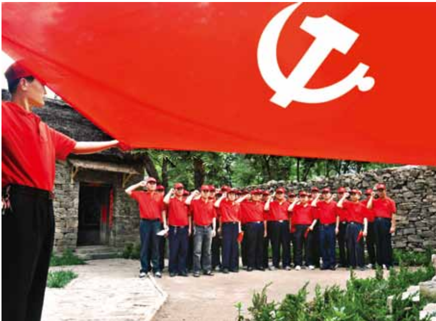
“不忘初心 牢记使命”入党宣誓

习近平总书记指出，坚持党的领导、加强党的建设，是我国国有企业的光荣传统，是国有企业的“根”和“魂”，是我国国有企业的独特优势。中国联合水泥党委自2007年成立以来，始终坚持党对企业的全面领导，注重加强从严治党，认真贯彻落实党的十七大、十八大、十九大及历次全会精神、全国国有企业党建工作会议精神和党中央、国资委关于加强和改进国有企业党建工作的一系列方针政策以及中国建材党委的部署要求，积极探索党委发挥领导作用，加强企业党建工作规范化科学化建设的有效途径和方法，按照宋志平董事长提出的“党建账与经济账合为一本账”的指示精神，将党建与经营深度融合，以高质量的党建工作引领和保障企业实现了高质量发展。