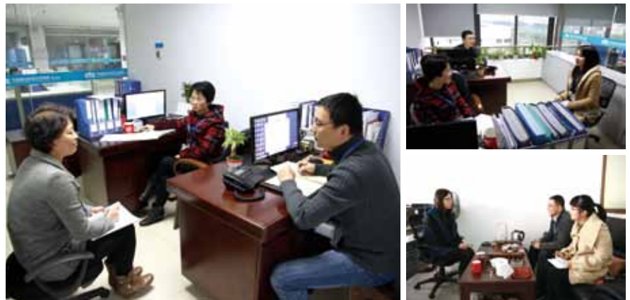
外埠分公司绩效辅导面谈与规范化管理巡查