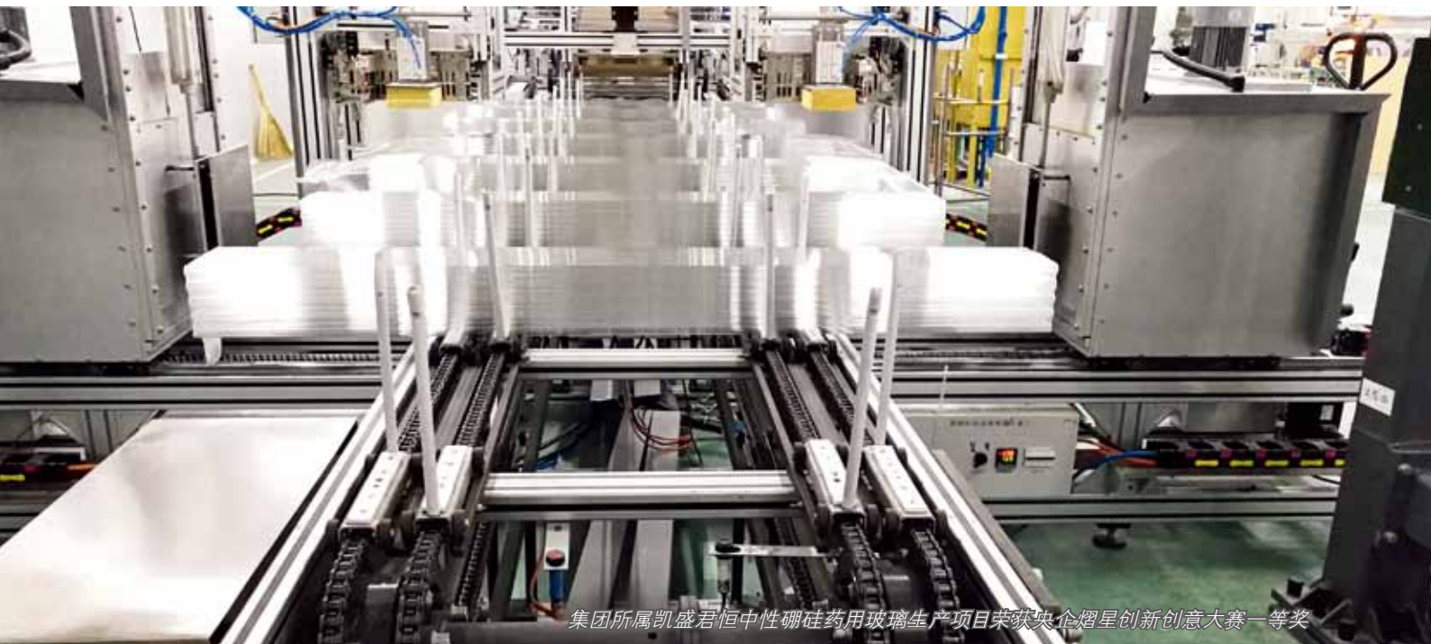
集团所属凯盛君恒中性硼硅药用玻璃生产项目荣获央企熠星创新创业大赛一等奖