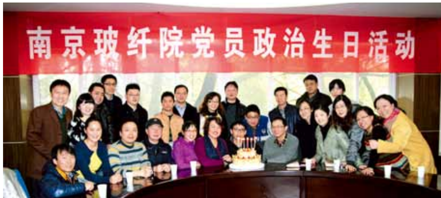
党员政治生日切蛋糕

主要创新点： 创新党员思想政治教育新模式。一是建立一个组织体系。建立党委领导、党群负责、支部落实的工作体系。二是夯实二个工作机制。建立政治生日活动工作机制，明