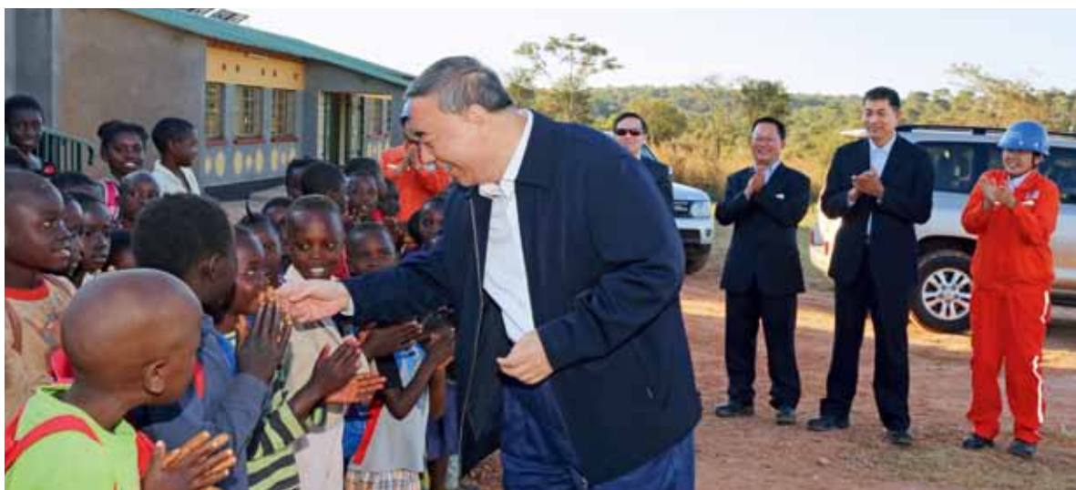
宋志平到中国建材赞比亚工业园捐建的学校看望师生