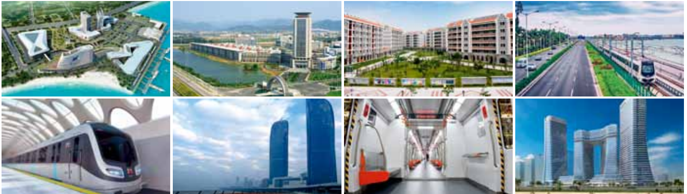
公司承接的主要重点工程项目

由中国建筑材料科学研究总院作为控股股东发起成立的中国建材检验认证集团股份有限公司(股票简称:国检集团),2016年11月9日成功登陆上海主板发行上市。这是一个激动人心的时刻,这也是中国建材工业几代检验认证人努力的结果,是我国建材工业的一件大事。中国建材集团有限公司董事长宋志平在现场还即兴赋诗一首:“国检登陆上海滩,资本市场谱新篇。宾朋满座人气旺,锣声敲响涨停板。十年埋头磨一剑,梅花香自苦寒来。金字招牌信为本,世界一流永向前。”