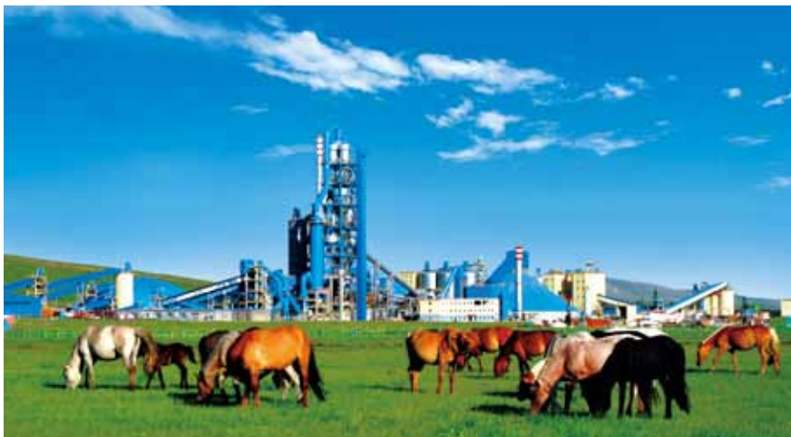
蒙欣巴音嘎拉有限责任公司

教育、“两学一做”学习教育和“不忘初心、牢记使命”主题教育，不断提升党建工作规范化科学化水平，开创了党建工作新局面。