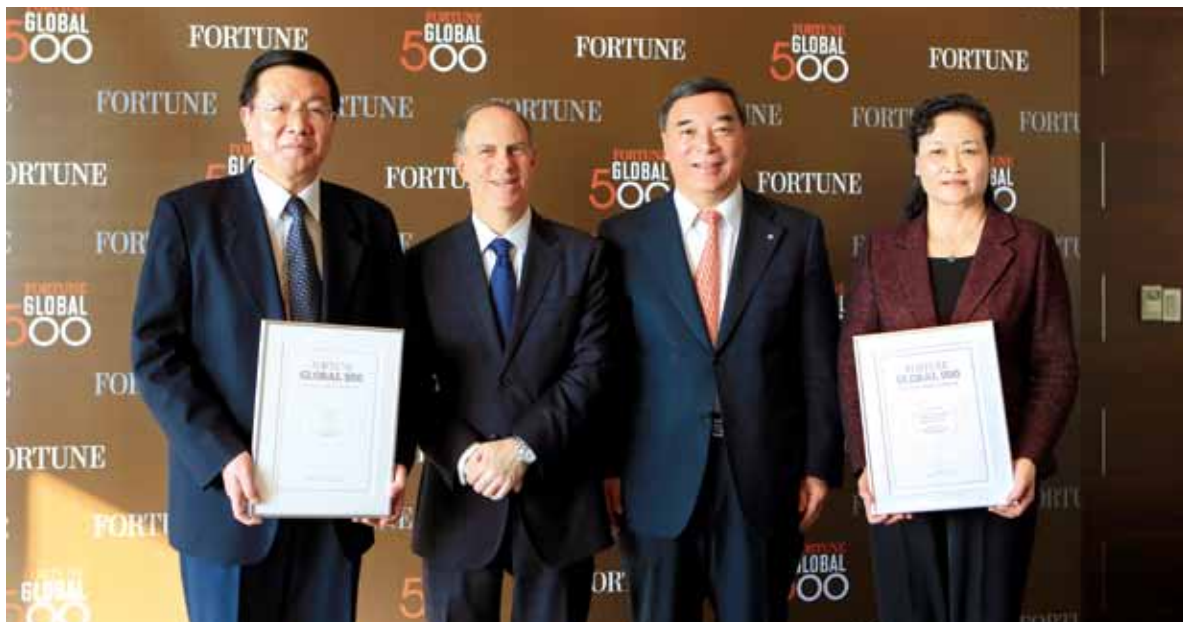
宋志平带领两家企业进入世界五百强

改革发展不断探索新路，为促进区域合作、联动发展作出更大贡献”。他的话不多，但字字千钧。第一句话他提出“战略整合的既定目标”，他断定中国建材是在做一场战略整合，而不是小小的收购。第二句话“为国企改革探索新路”，他认为这次整合是国企改革的一件大事。第三句话“为区域合作、联动发展作出更大贡献”，这场重组最终是要区域合作，要联动发展，现在我们所做的工作就是起到了这个作用。我有时常想，这么短短的一段话，里面多少含义，中国建材今天做的恰恰就是这些，后来国药集团做的也是这些。