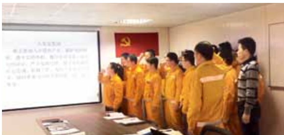
埃及G6项目部党支部开展“重温入党誓词”主题党日

中国建材集团所属成都建材院埃及GOE Beni Suef项目部（以下简称埃及G6项目）党支部正在召开支委会，研究讨论如何做好党建工作，如何真正发挥支部、党员的作用，为项目优质高效履约提供保障。