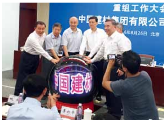
2016年8月26日，两材重组大会召开，中国建材集团有限公司正式成立

2016年8月我们行业里发生了大事——两材重组，中国建材和中国中材两家央企合并在一起。我们