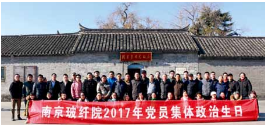
2017年党员“政治生日”活动在淮安周恩来纪念馆举行

一是党员思想作风建设得到不断强化。 通过品牌创建，进一步强化思想政治教育，有效推进党员自觉加强党性修养和党性锻炼，自觉聚焦新形势合格党员标准，找差距、补短板，不断提升引领改革发展的素质能力和营造风清气正的政治生态。