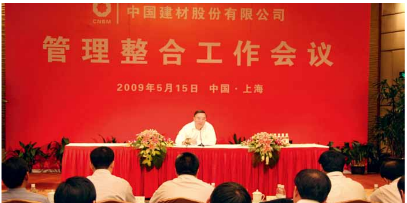
宋志平董事长在中国建材股份管理整合大会上作重要讲话

对中国建材来讲，我们能做的事儿真的很多，为什么？因为我们能够包容，有包容就能够做成我们想做的事儿。