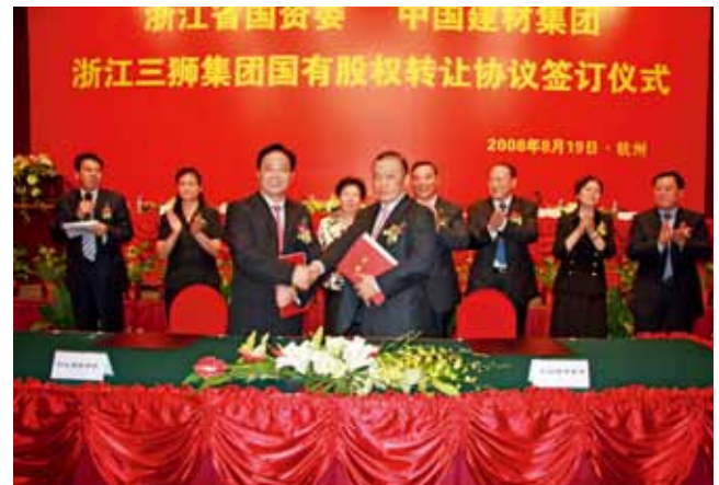
2008年8月19日，浙江三狮集团国有股权转让协议签订仪式