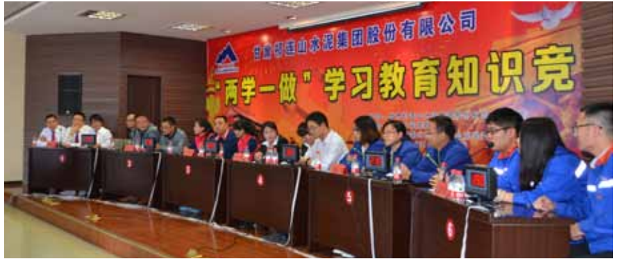
开展“两学一做”学习教育知识竞赛

和半年时将工作会与党建及党风廉政建设会同时召开，在总结安排生产经营工作同时，总结安排党建工作。坚持落实主体责任有措施、留痕迹，班子成员尤其主要领导大会小会必强调党建和党风廉政建设，要求安排和调研业务工作必须同步安排和调研党建工作，基层单位在汇报业务工作时也能够主动汇报党建工作，形成了党政同力、齐抓共管的党建工作格局。坚持和完善“双向进入、交叉任职”的领导体制，凡是子公司领导班子成员中的党员均为党委会成员，调整领导班子必同步调整党委班子，实现了党政同责、一岗双责。定期召开党建工作研讨会，围绕加强公司党的建设等进行座谈交流，凝聚思想共识。以党建责任考核为抓手，以强化考核结果运用为关键，坚持开展党建工作年度检查考核，把考评结果与生产经营目标责任制考核、领导人员薪酬奖惩双挂钩，建立了刚性管用、有效激励的党建考核机制，把党的政治优势转化为企业的发展优势、竞争优势。聚焦党委书记这个关键少数，从2015年起每年组织开展党委书记抓党建工作现场述职评议，将评议结果纳入年度考核，进一步强化了基层党委的主业主责意识。重视加强党的群团建设，定期召开党委会研究群团工作，指导群团组织依据各自章程独立自主地开展工