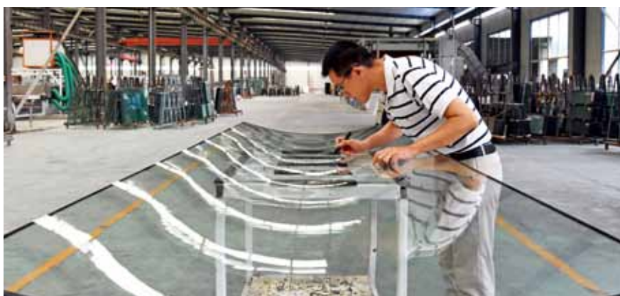
检查曲面复合防火玻璃表面通透性

存在的主要技术问题是微气泡难以消除，外观不如国外品牌；耐紫外线辐照性能较差，大部分产品长时间在户外使用，会出现发乌、出泡等问题。