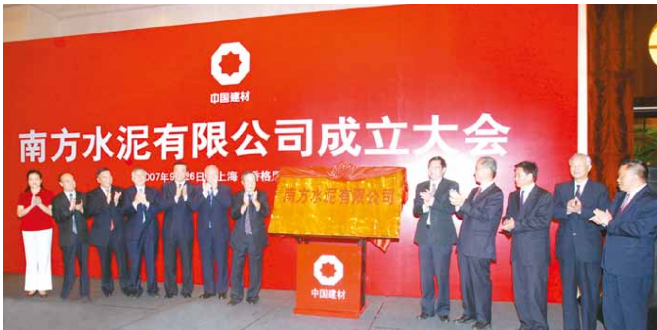
2007年9月26日 南方水泥有限公司在上海挂牌成立

府也希望我们央企去整合；三是我们有一套包容的文化；四是在中国建材发展历程中，我们跟若干家民企进行了合作，合作效果都非常好，口碑也很好，大家愿意跟中国建材合作。所以在组建南方水泥时，中国建材在这个区域得到了政府、行业协会和企业的信任和支持，在很短的时间内从一两水泥也没有，一下子重组了100多家企业，发展成为拥有上亿吨产能的水泥公司。真的，这是一件非常了不起的事情。