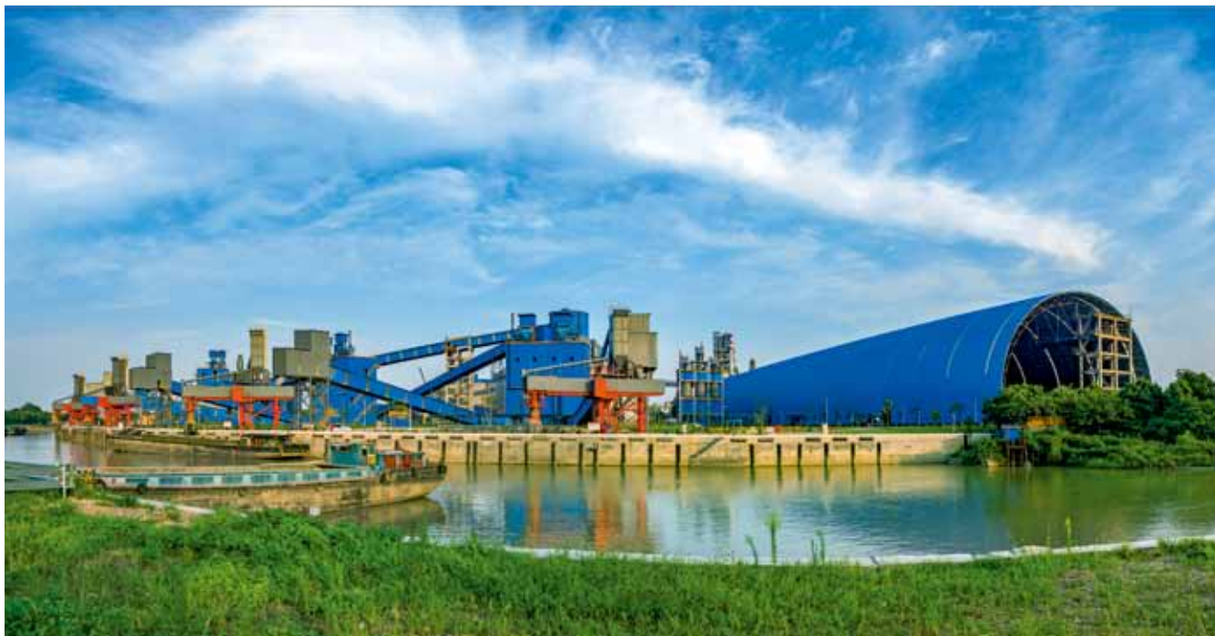
湖州南方物流有限公司码头全景

力发展混合所有制，把民企的一些市场机制引入到央企内部，包括请民营企业来做职业经理人等，充分增加了我们企业的活力，因为民营企业有市场拼搏精神、企业家精神，本身他们对当地又很熟悉，这也很重要。